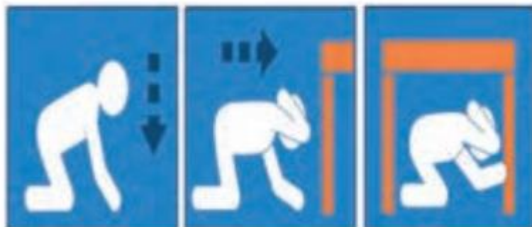
سه مرحله: ۱- بنشین، ۲- پناه بگیر، ۳- صبر کن

۴) اگر در خیابان هستیم از ساختمانهای بلند و تیرهای چراغ برق و تابلوی مغازه ها فاصله بگیریم و اگر در حال رانندگی هستیم خورورا در کنار خیابان یا جاده و دور از ساختمان های بلند یا تیرهای برق و متوقف کنیم و تا پایان زمین لرزه در خودرو بمانیم.