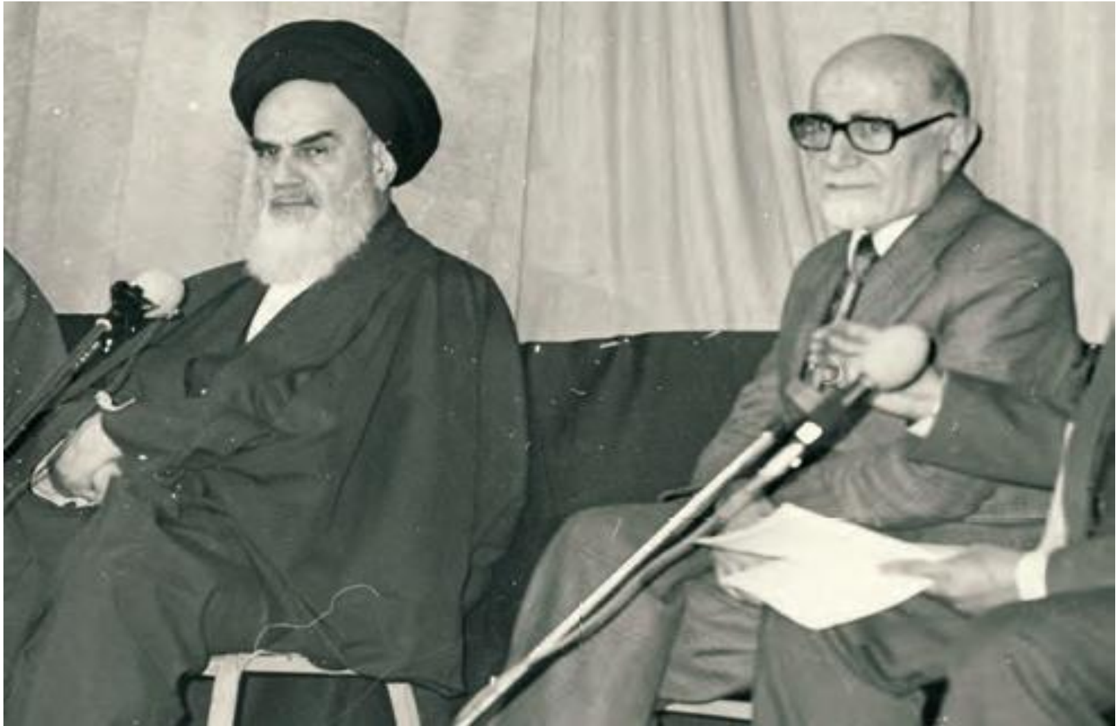
مهندس مهدی بازرگان، رئیس دولت موقت انقلاب، در کنار امام خمینی (ره)