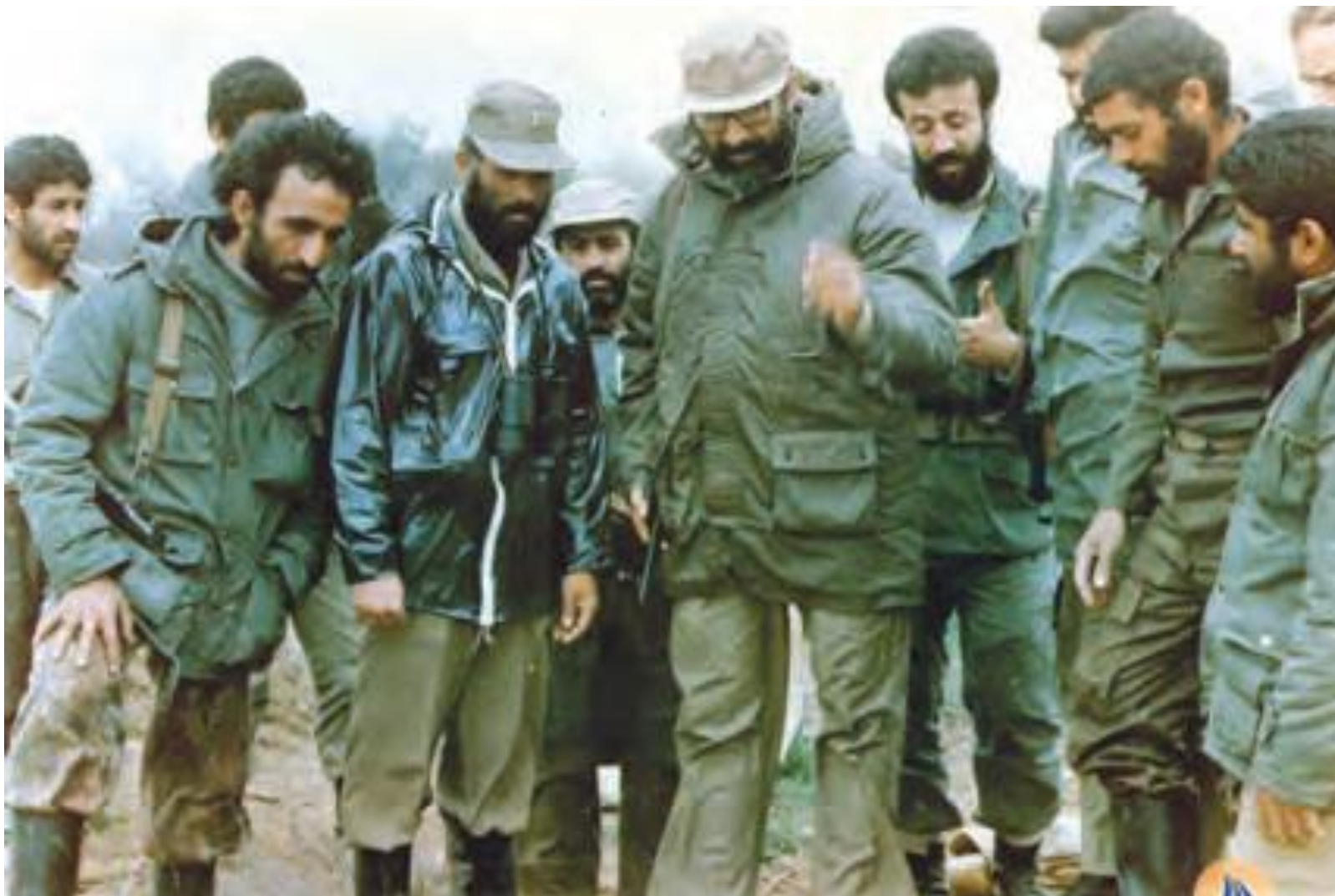
شهید مصطفی چمران به همراه جمعی از رزمندگان در جبهه