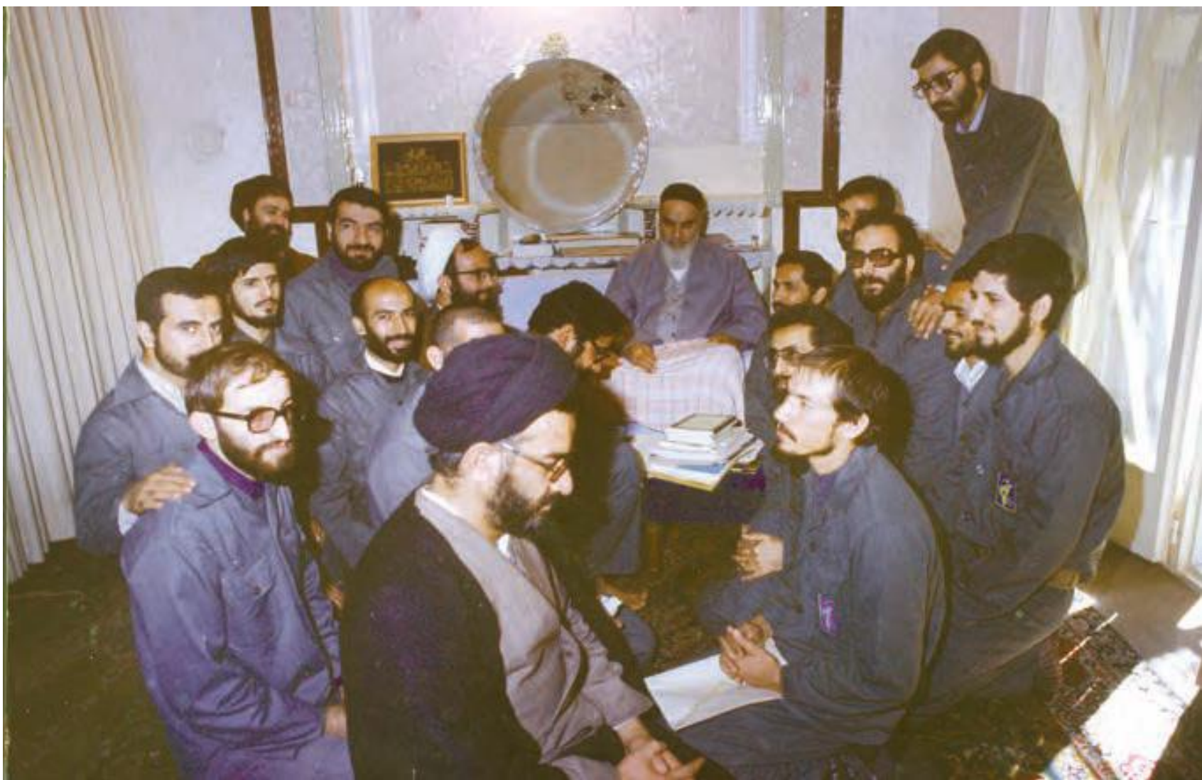
جمعی از فرماندهان ارشد سپاه در دوران دفاع مقدس در دیدار با حضرت امام