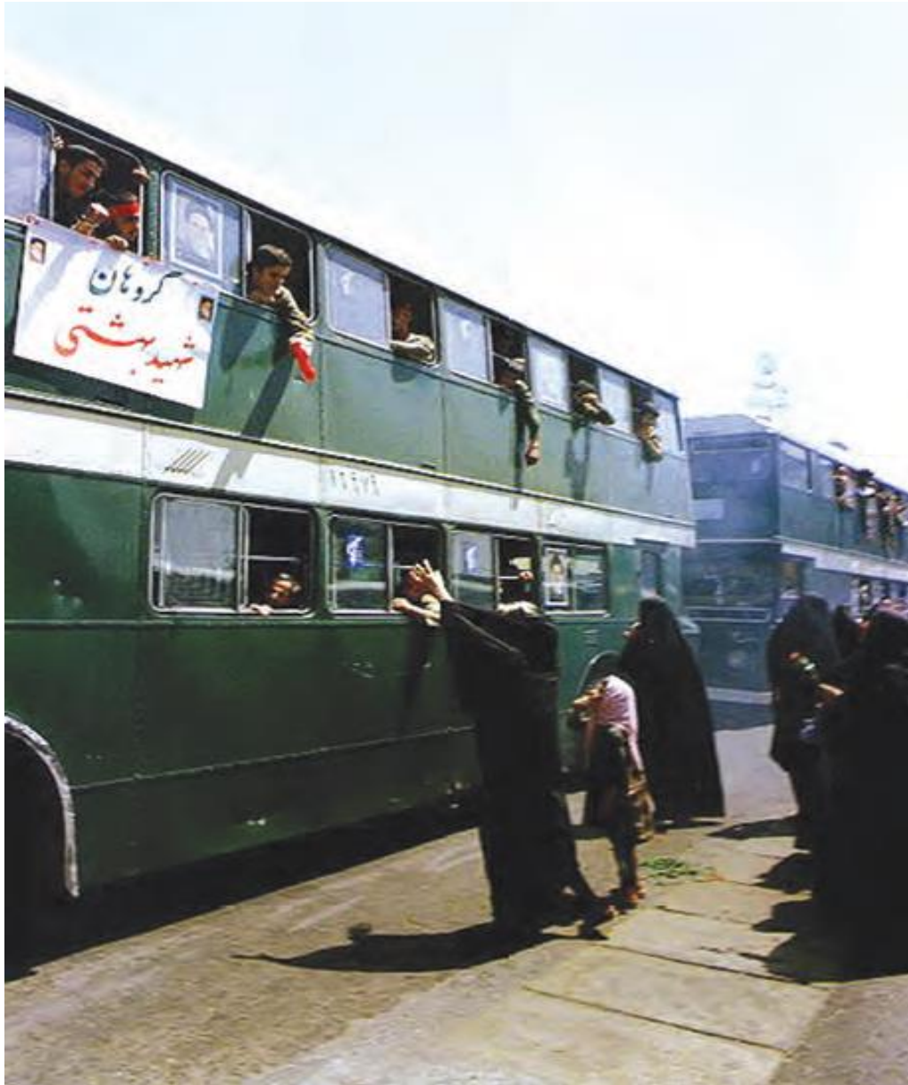
بدرقه رزمندگان اسلام توسط خانواده ها - تهران