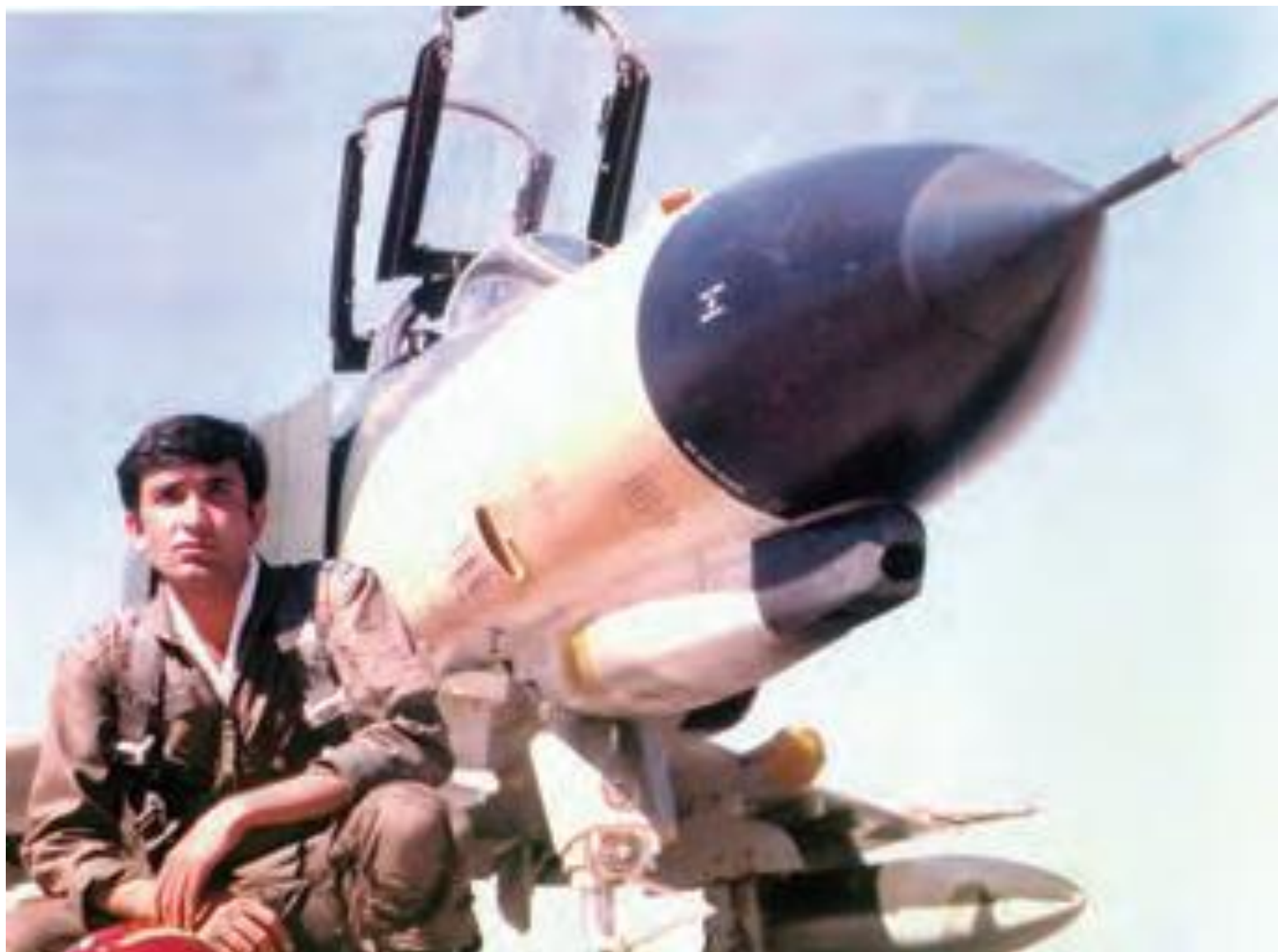
خلبان شهید عباس دوران