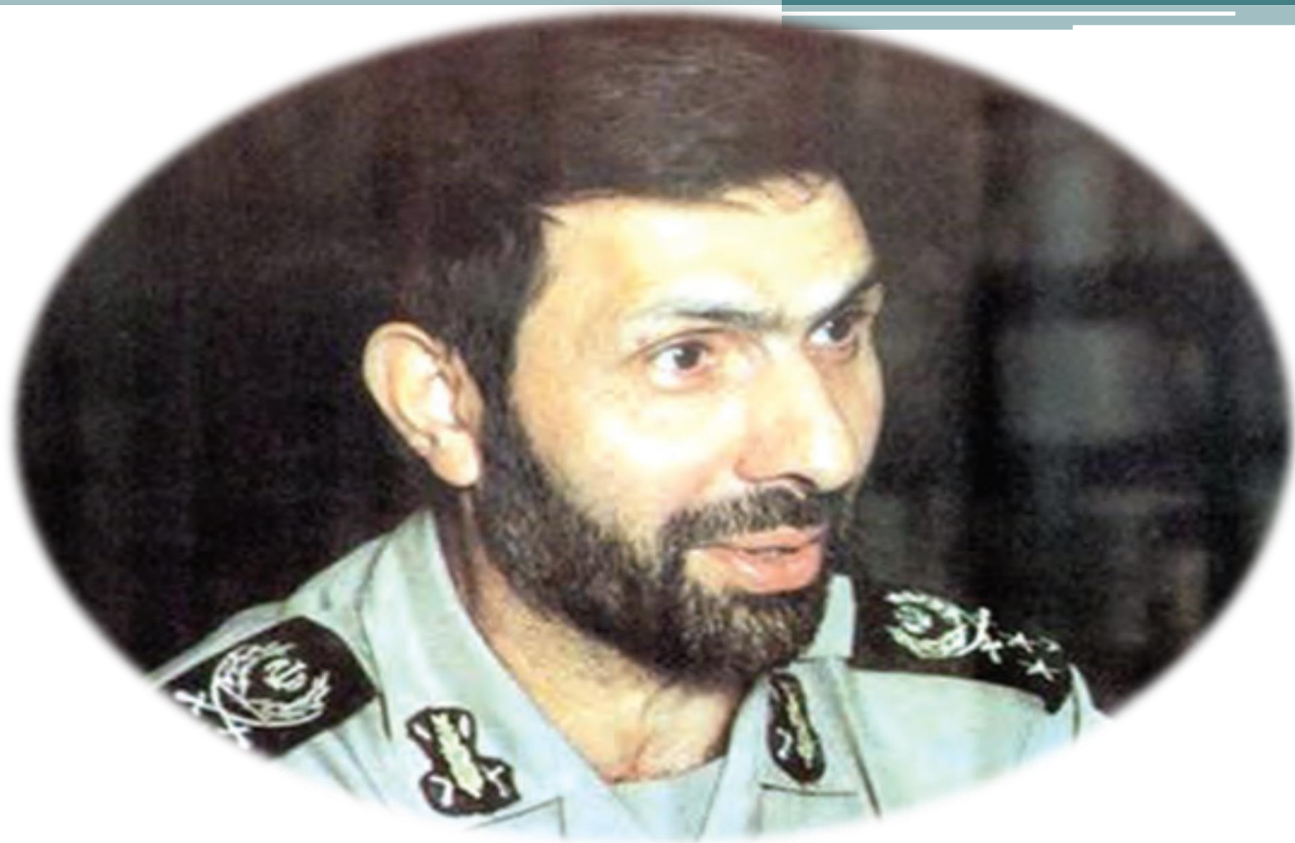
شهید سپهبد علی صیاد شیرازی (۱۳۲۳- ۷۸) دانشجو از اپلیکیشن پادرس دفاع مقدس رشادت زیادی از خود نشان داد.