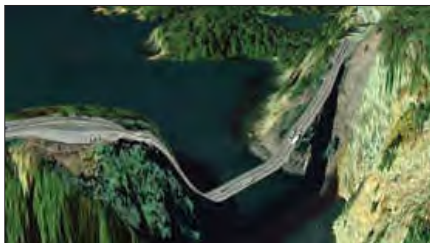
پلی در جزیره کانتی واشنگتن

ما حتی اگر درباره علوم طبیعی اطلاعات چندانی نداشته باشیم، می‌پذیریم که این علوم خوب هستند و نتایج سودمندی دارند.