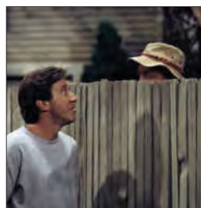
■ بررسی پدیده های خرد و کلان در جامعه شناسی شهری؛ روابط همسایگی، ریخت شناسی شهری، ترافیک، آلودگی و مهاجرت.

۱- با مفهوم ساختار اجتماعی در درس بعد آشنا می شوید.