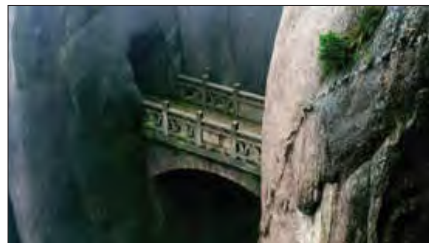
پل جاودانه‌ها، هانگ‌شانگ چین