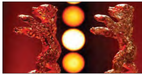
■ جشنواره‌های فیلم و موسیقی برای داوری بهترین‌های دنیای هنر