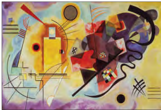
■ زرد، قرمز، آبی اثر واسیلی کاندینسکی، خالق نقاشی‌های مدرن انتزاعی. این نقاشی‌ها، تفاسیر عمیقی با خود دارند و چیزی که در ظاهر به نظر می‌رسند، نیستند. شکل‌ها و رنگ‌ها به واقعیتی مشخص بیرون از ذهن اشاره ندارند.