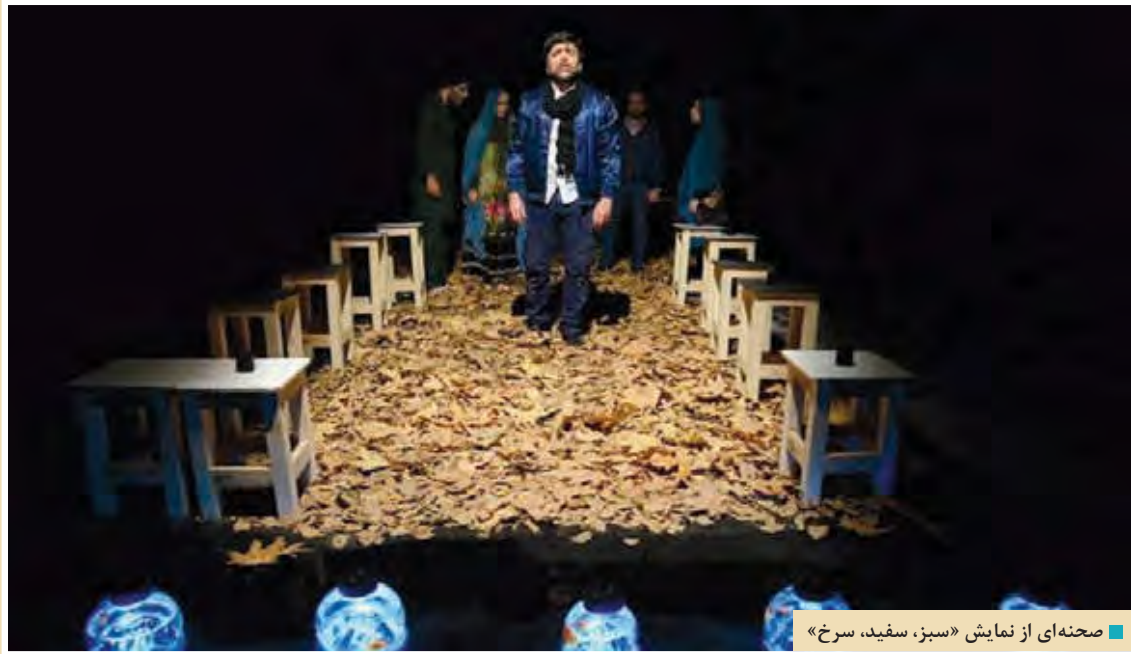
صحنه‌ای از نمایش «سبز، سفید، سرخ»