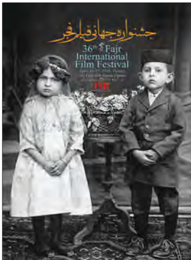
■ جشنواره جهانی فیلم فجر هر ساله در تهران برگزار می‌شود و مهم‌ترین جشنواره سینمایی ایران است.