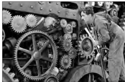
■ انسان در فیلم سینمایی «عصر جدید»، شیء و در فیلم سینمایی «تلقین»، موجودی آگاه دانسته شده است.

هر عبارت به کدام پیامد نادیده گرفتن کنش اشاره دارد؟ شهریور 98