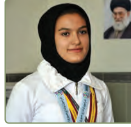
هَذِهِ، لاعبةٌ نَاجِحَةٌ.

تهیه شده توسط سرگروه عربی شهرستان بندر ماهشهر شهریور 1400