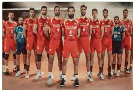
هُؤْلَاءِ، إِيْرَانِيَّوْنَ. هَذِهِ، صَوْرَةُ اللَّاعِبِيْنَ الْإِيْرَانِيَّيْنَ. هُؤْلَاءِ اللَّاعِبُوْنَ، فَائِزُوْنَ.