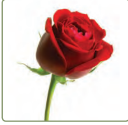
هَذِهِ، وردَةٌ جَمِيلَةٌ.