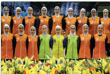
هُؤْلَاءِ، إِيْرَانِيَّاتٍ. هَذِهِ، صَوْرَةُ اللَّاعِبَاتِ الْإِيْرَانِيَّاتِ. هُؤْلَاءِ اللَّاعِبَاتِ، فَائِزَاتٌ.