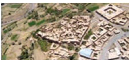
محوطه باستانی جندی شاپور