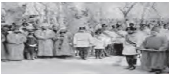
آیین نوروز در دوره قاجار

قوی می تواند اشتراکات فرهنگی زیادی بین کشورها ایجاد کند تا زمینه همکاری های اقتصادی و منطقه ای دیگر را فراهم کند.