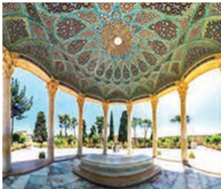
نقش آرامگاه حافظ در شیراز نمونه‌ای زیبا از ترکیب معماری ایرانی-اسلامی

۳۱- به چه دلیل، فرهیختگان ایرانی، افق دید و باورشان از اسلام، بسیار ژرف تر از دایره تنگ نظری های خلفای اموی و عباسی بود؟