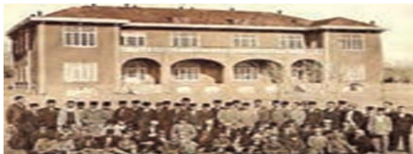
عکس یادگاری در مقابل سالن مک کورمیک کالج آمریکایی تهران

۳۳- فرهنگ مدرن در اروپا، چه زمانی و چگونه به وجود آمد؟