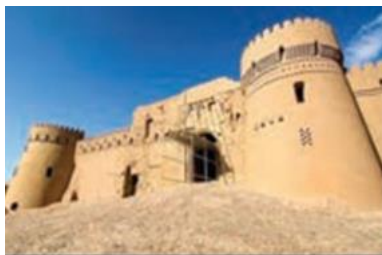
بازسازی و مرمت ارگ بزم