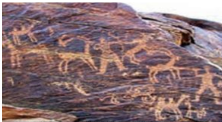
نگاره های تیره (منطقه ای مابین سه استان اصفهان، مرکزی و لرستان)

(ج) طبق اسناد تاریخی و به گواهی بسیاری از مورخان، نویسندگان و حتی مستشرقان منصف، فرهنگ ایرانی در این دوران از برجستگی های ویژه ای برخوردار بوده است و مردم ایران به لحاظ فرهنگی، علاقه مند به دانش، صلح دوست، اهل مدارا، هنر دوست و راستگو بوده اند؛ به گونه ای که حتی مهاجمان و مهاجران به این سرزمین، پس از مدتی، تحت تأثیر فرهنگ ایرانی قرار گرفته و از پیروان آن شده اند.