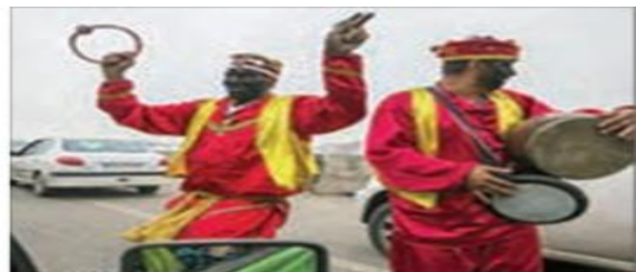
زنده کردن دوباره آیین میر نوروزی