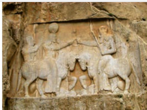
نقش برجسته بخشیدن حلقه شاهی از سوی اهورا مزدا به اردشیر ساسانی (نقش رستم)