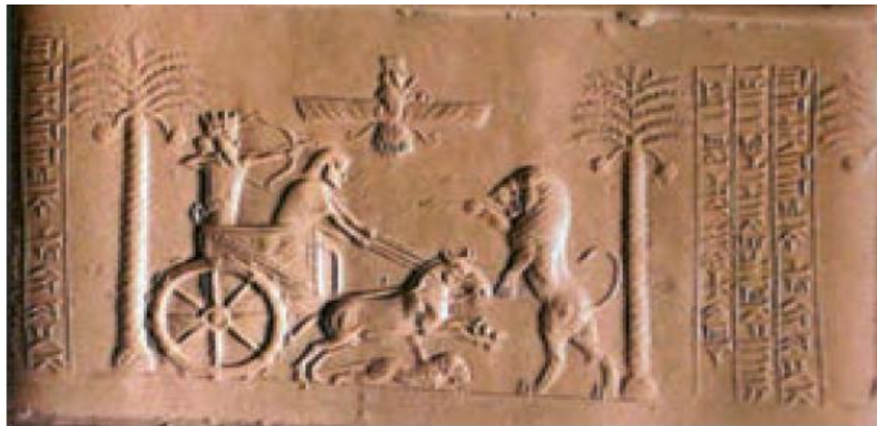
مهر سلطنت داریوش هخامنشی، طول مهر ۳/۵ سانتی متر است. در موزه بریتانیا در لندن نگهداری می شود. اسم داریوش روی مهر به سه خط ایلامی، پارسی و بابلی نوشته شده است.

شاهان بر امور اداری و نظامی و مذهبی فرمانروایی مطلق داشتند. آنها برای اداره کشور فرمان هایی صادر می کردند این فرمان ها، قانون هایی بودند که باید در سراسر کشور اجرامی شدند و هیچ کس نباید از آنها سرپیچی می کرد. روی فرمان ها و نامه های مهم، مهرهای مخصوص شاه زده می شد