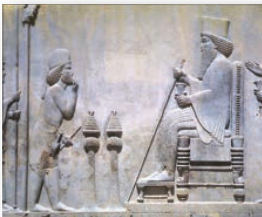
نقش برجسته داریوش در تخت جمشید

شاهان ایران باستان خود را برگزیده ی آسمان و نماینده ی اهورامزدا می دانستند و معتقد بودند که به حکم او فرمان می رانند. البته این عقیده هم وجود داشت که اگر شاه از مسیر قانون و عدالت منحرف شود حمایت اهورایی از او گرفته می شود و بزرگان و موبدان می توانستند او را عزل یا برکنار کنند.