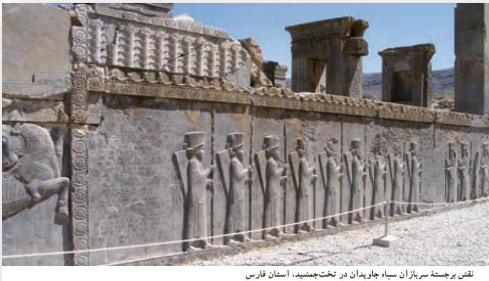
نقش برجسته سربازان سپاه جاویدان در تخت جمشید، استان فارس

یکی از ابتکارات داریوش بزرگ هخامنشی تشکیل سپاه جاویدان بود. این سپاه از ده هزار نفر تشکیل می شد که به گروه های ده نفره تقسیم می شدند به این سپاه، جاویدان یا همیشگی می گفتند چون هرگاه یکی از افراد از بین می رفت و فرد جنگاور دیگر که ذخیره بود جای او را می گرفت و تعداد آنان کاسته نمی شد. در آن دوره بزرگترین آرزوی جوانان پارسی خدمت در این سپاه بود.