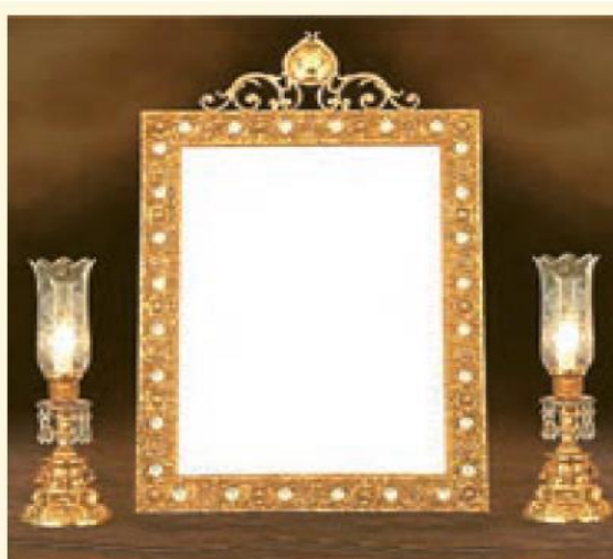
استفاده از آینه و شمعدان در مراسم ازدواج یکی از رسوم به جامانده از ایران باستان است. در آن دوره در مراسم ازدواج از آینه به عنوان نماد راستی و صداقت در زندگی مشترک استفاده می کردند.

ازدواج معمولاً خویشاوندی و درون گروهی بود؛ یعنی اغلب سعی می کردند با افرادی از دودمان خود ازدواج کنند تا با آنها هم خون باشند و خصوصیات آن دودمان را حفظ کنند.