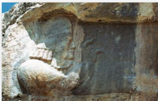
نقش برجسته کرتیر، موبد معروف دوره ساسانی در نقش رجب (استان فارس)

دوره ایران باستان، شاهان و شاهزادگان زندگی بسیار پرتجملی داشتند و در کاخ‌ها به خوشگذرانی می‌پرداختند. برای مثال خسرو پرویز تاجی داشت که مقدار زیادی طلای خالص در آن به کار برده شده بود و مرواریدهای آن به اندازه تخم گنجشک بودند. در آن دوره، تاج سنگین را از سقف آویزان می‌کردند و شاه زیر آن می‌نشست. خسرو پرویز شطرنجی داشت که مهره‌های آن از یاقوت و زمرد بود و بر تختی می‌نشست که از عاج فیل درست شده و نرده‌های آن از طلا و نقره بود.