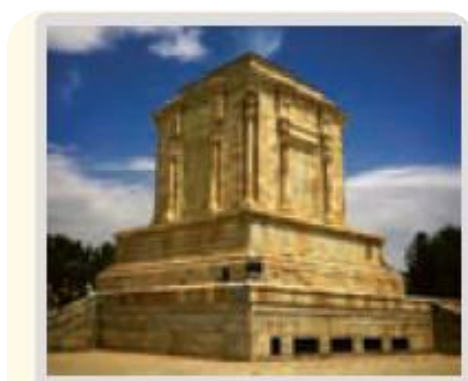
آرامگاه فردوسی، خراسان رضوی