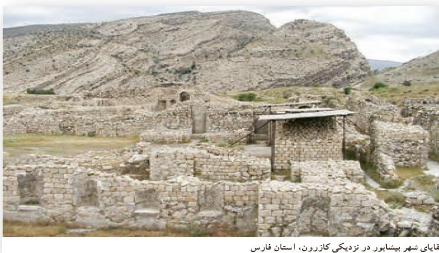
بقایای شهر بیشاپور در نزدیکی کازرون، استان فارس

در دوره ایران باستان، اغلب مردم در روستاها زندگی می کردند و کشاورزان بیشترین جمعیت آن زمان را تشکیل می دادند. البته تعدادی قبایل نیز در گوشه و کنار سرزمین ما زندگی می کردند. تا قبل از سلسله ساسانیان، شهرهایی در قلمرو ایران ساخته شدند، اما تعدادشان زیاد نبود. این شهرها بیشتر محل زندگی شاهان و مأموران حکومت بود. در دوره ساسانیان، فرمانروایان شهرهای زیادی بنا کردند و جمعیت شهری به طور چشمگیری افزایش یافت. در این شهرها علاوه بر مأموران حکومتی، صنعتگران، بازرگانان و پیشه وران نیز زندگی می کردند.