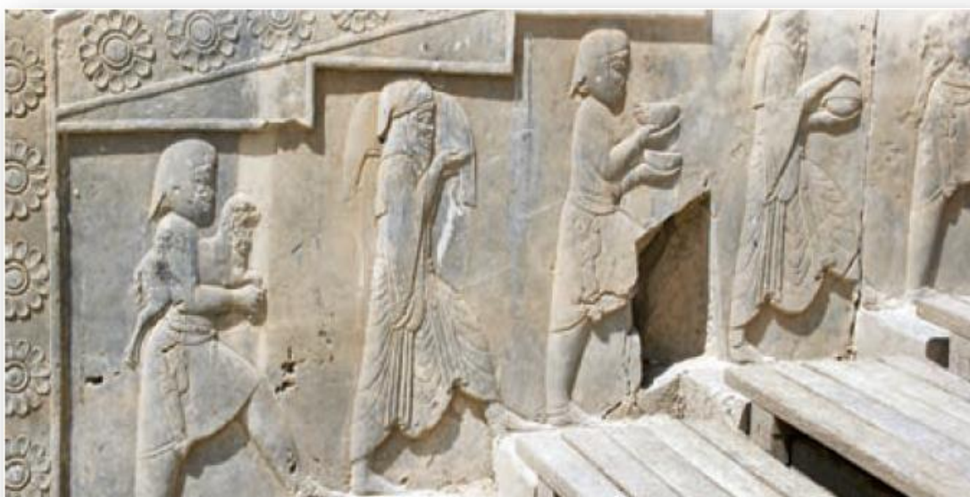
نقش برجسته خدمتکاران در تخت جمشید، استان فارس

بخش زیادی از درآمدهای حکومتی صرف جنگ با دشمنان می شد. قسمت دیگری از آن، به مصارف شخصی شاه، شاهزادگان، درباریان و ساختن کاخ های مجلل می رسید. حکومت ها همچنین بخشی از درآمد را در اموری مانند پرداخت حقوق به ماموران حکومتی و همچنین احداث، نگهداری و تعمیر آتشکده ها، کاروان سراها، قنات ها، سدها و..... خرج می کردند.