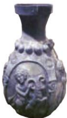
تنگ نقره ای ساسانی

ایرانیان باستان مواد غذایی مانند روغن زیتون را از {یونان} و انواع ادویه را از {هندوستان} وارد می کردند .