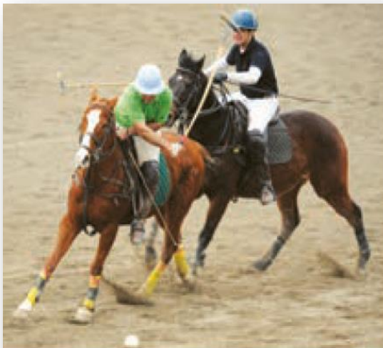
تصویری از بازی چوگان در ایران امروز

سوارکاری و تیراندازی و شکار از ورزش های مورد علاقه مردم آن دوره بوده و پرتاب سنگ یا فلاخن و نیزه و زوبین نیز رواج داشته است. بسیاری از پژوهشگران معتقدند چوگان بازی ورزشی است که ایرانیان باستان آن را ابداع کرده اند و سپس از ایران به سایر کشورها راه یافته است. در شاهنامه فردوسی به چوگان بازی اشاره شده است. در زمان هخامنشیان و ساسانیان این ورزش انجام می شده است.