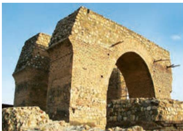
بقایای آتشکده تپه میل، جاده ری - ورامین - تهران

زرتشت پیامبر ایران باستان که قبل از سلسله ی مادها می زیست در اندیشه ی اصلاح عقاید مذهبی برآمد او مردم را به پرستش اهورا مزدا خدای بزرگ یکتا دعوت می کرد و پیروان خود سفارش می کرد که به منظور یاری اهورا مزدا {پندار نیک، گفتار نیک، کردار نیک} را سرمشق زندگی خود قرار دهند.