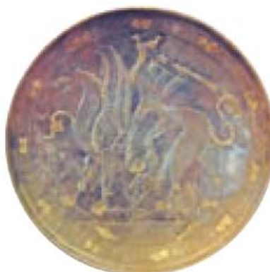
بشقاب زرین متعلق به دوره ساسانی