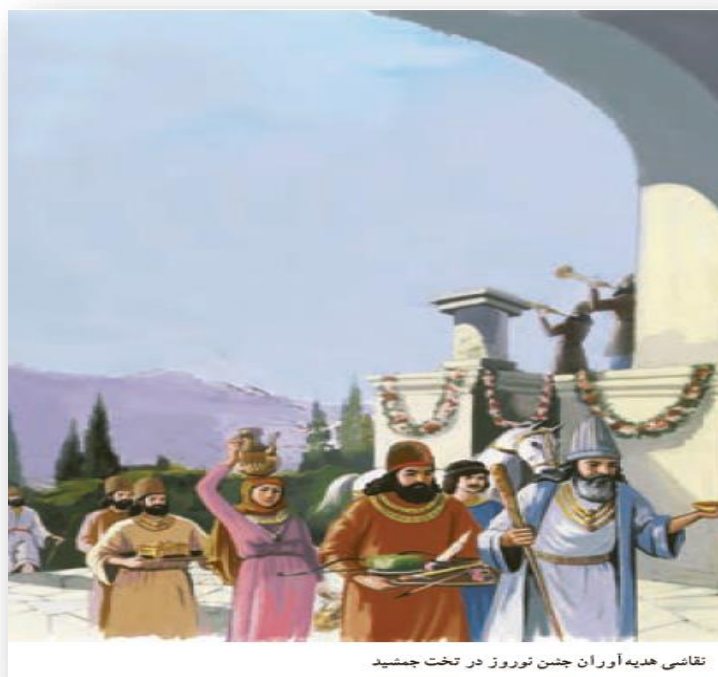
تقاسی هدیه آوران جشن نوروز در تخت جمشید

نوروز یکی از بزرگ ترین و باشکوه ترین جشن های ایران باستان بوده که در آغاز فصل بهار برگزار می شده است. نوروز در نزد مردم آن زمان پیام آور نو شدن سال و رویش طبیعت و شروع فعالیت های کشاورزی بود. زمان پیدایش نوروز به درستی معلوم نیست، اما در برخی از کتاب های کهن مانند شاهنامه فردوسی، این جشن را به زمان تاج گذاری جمشید پادشاه اسطوره ای ایران نسبت