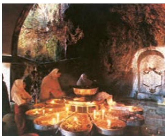
زیارتگاهی در استان یزد از مکان های مقدس زرتشتیان