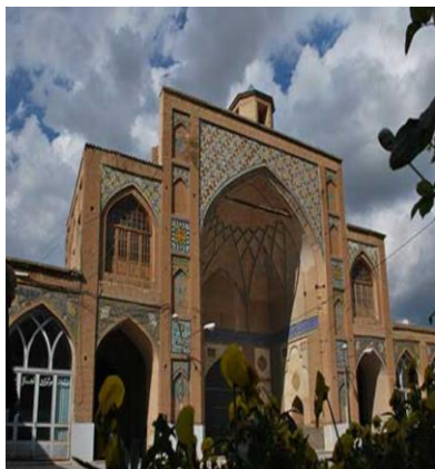
مسجد جامع بروجرذ یکی از نخستین مسجدهای ساخته شده در ایران است