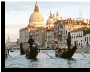
ونیز در ایتالیا

۲. حدس بزنید عکسهای شماره ۳ و ۴ کدام مکان های گردشگری در اروپا را نشان می دهد؟