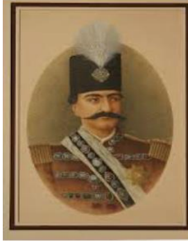
ناصرالدین شاه قاجار

کشورهای استعمارگر روسیه و انگلستان در دوره ناصرالدین شاه به امتیازهای اقتصادی مهمی مانند تأسیس بانک، استخراج معادن نفت، بهره برداری از جنگل و شیلات در ایران دست یافتند. صنعت و بازرگانی کشور ما با واگذاری این امتیازها آسیب های فراوانی دید.