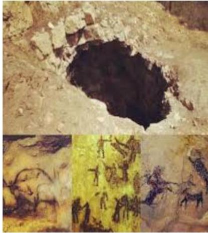
غار دوشه خرم آباد