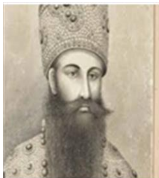
عباس میرزا، نخستین اصلاح طلب

عباس میرزا، ولیعهد فتحعلی شاه و فرمانده لشکر ایران در جریان جنگ با روسیه، متوجه تأثیر علم و صنعت بر پیشرفت های نظامی آن کشور شد و به این نتیجه رسید که تعداد زیاد سپاهیان ایران و دلاوری و فداکاری های آن ها، برای پیروزی کافی نیست. از این رو به فکر نوسازی و اصلاح امور کشور افتاد.