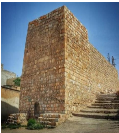
آسیاب گبری از مکانهای تاریخی استان لرستان