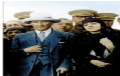
اقدامات آتاتورک: کشف حجاب، تغییر خط عربی به لاتین، تبدیل مسجد ایاصوفیا به موزه، لغو تقویم هجری، بخش اذان به زبان ترکی. انتشار اسکناس با نماد پان ترکیسم و ...

۲۱- قدرت حاکمان سکولار در کشورهای اسلامی به چه چیز وابسته بود؟