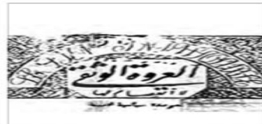
تشریح های درباره خودباوری مسلمانان و مبارزه با استعمار که سیدجمال الدین اسدآبادی با همکاری محمّد عیبه در پاریس منتشر و در دهها کشور آسیایی و آفریقایی توزیع می کرد.

۸- نخستین بیدارگران اسلامی چه کسانی بودند؟