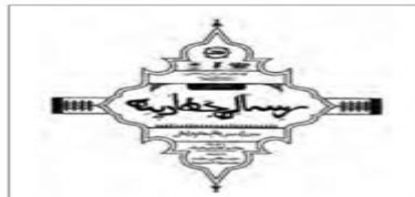
در حمله روسیه تزاری به ایران، عده زیادی از علمای اسلام با تدوین کتابها و رساله های گوناگون، حکم جهاد با کفار را به طور مستدل و مشروح بیان کردند. این رساله ها با عنوان جهادیه شناخته می شوند.

قدرت نظامی، سیاسی، اقتصادی و جاذبه های دنیوی کشورهای غربی، دولتمردان کشورهای اسلامی را مرعوب و شیفته فرهنگ غرب می ساخت این مسئله عزت و استقلال کشورهای اسلامی را تضعیف می کرد.