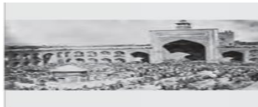
واقعه مسجد گوهرشاد