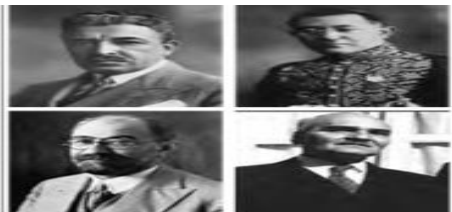
علی اکبر داوود، عبدالحسین خان تیمورتاش، تقی زاده و محمد علی فروغی از جمله چهره های منورالفرکی بودند که در کابینه رضاخان حضور داشتند.