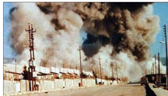
■ سردشت، شهر قربانی جنگ‌افزارهای شیمیایی غرب