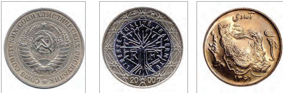
■ آرمان‌های انقلاب اسلامی ایران با آرمان‌های انقلاب فرانسه و روسیه متفاوت است.