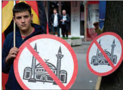
■ اسلام‌هراسی در غرب