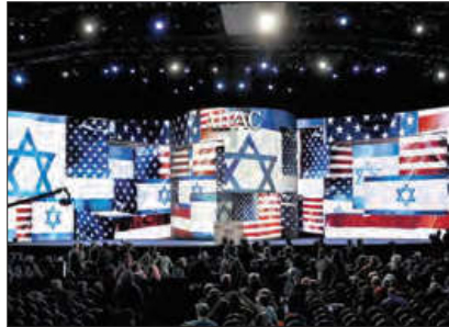
■ استقبال آ‌ی‌پک از تصویب تحریم‌های ضدایرانی در سنای آمریکا