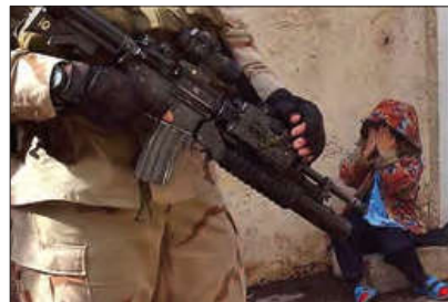
■ نظامیان آمریکایی در عراق و افغانستان

دنیای غرب، برای رفع نیازهای اقتصادی و سیاسی خود، با حرکت های مستقلى که در جهان اسلام شکل گرفته، مقابله می کند، نمونه هایی از این فعالیت ها