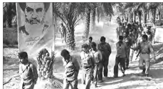
■ اعتراف رسانه‌های غربی به کمک تسلیحاتی غرب به صدام حسین