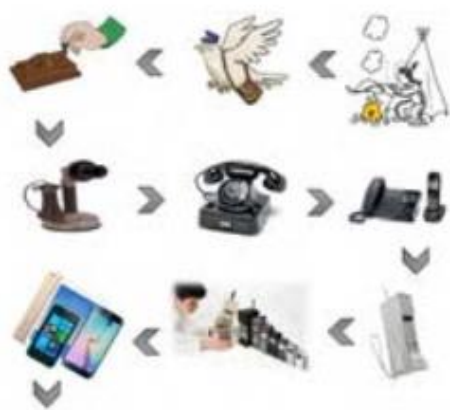
شکل ۱ مراحل ایجاد یک محصول (تلفن) و توسعه آن

منشاء تولید هر محصولی، در ابتدا احساس نیاز به آن محصول می باشد. پس از طرح احساس نیاز به یک محصول، افراد مختلفی، پیشنهادهایی را تحت عنوان ایده مطرح می نمایند. سپس از میان ایده های مختلف بهترین، ساده ترین و کم هزینه ترین ایده انتخاب شده و یک نمونه ی آزمایشگاهی از آن ساخته می شود. در صورت موفقیت آمیز بودن نمونه ی ساخته شده و مرتفع ساختن نیازمندی، محصول نهایی به صورت انبوه تولید شده و به این ترتیب کار و تولید و در کنار آن اشتغال و کسب درآمد، آغاز می شود.