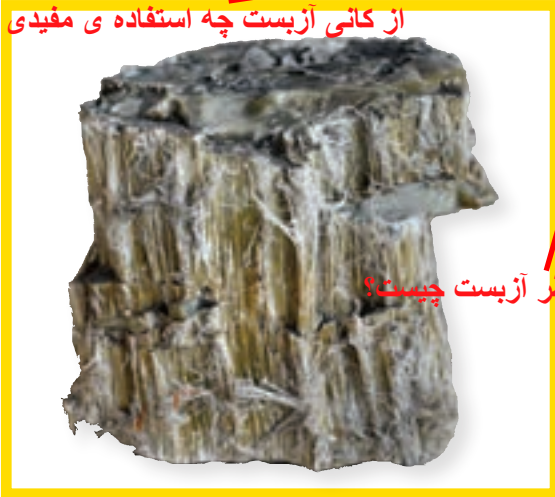
خطر آزبست چیست؟