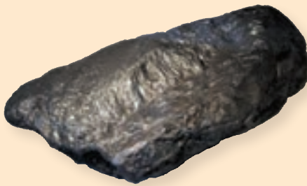
نوشتن و کاهنده ی اصطکاک

در شکل زیر دو کانی را مشاهده می کنید. درباره کاربرد هر یک از این کانی ها در زندگی گفت و گو کنید.