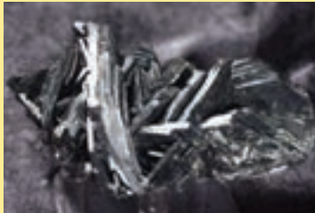
پ) هماتیت (سنگ معدن آهن)