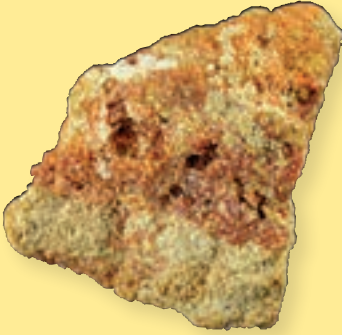
ب) کانی خادمیت

و رئیس وقت سازمان زمین‌شناسی کشور نام‌گذاری شد (شکل ۶-ب).