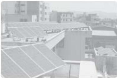
استفاده از صفحه‌های خورشیدی - اداره برق سمنان

از یک سو، انسان‌ها با پیشرفت در تولید ابزار و فناوری و دانش بر محیط طبیعی غلبه می‌کنند و آن را تحت اختیار خود درمی‌آورند؛ از سوی دیگر، ویژگی‌های هر ناحیه طبیعی همواره زندگی مردم ساکن در آن را تحت تأثیر قرار می‌دهد.