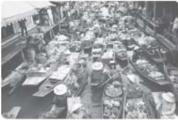
بازار شناور - بانکوک

مثال ۱ بازارهای شناور بانکوک (پایتخت تایلند) که از دیدنی‌های آسیای جنوب شرقی است، در اثر دخالت و دستکاری انسان در محیط ساحلی این ناحیه به وجود آمده است. در این بازارها، دست‌فروشان در قایق‌های چوبی بر روی رودخانه اصلی این شهر، کالاهای خود را برای فروش عرضه می‌کنند. این شیوه خاص فروش کالا، ناحیه تجاری و گردشگری خاصی را برای بازدید گردشگران خارجی ایجاد کرده است.